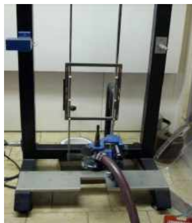
4. ábra. Az égési viselkedés vizsgálata az MSZ EN 407:1995 6.3 szakasza szerint

Az égési időtartam [s], az utánlángolási időtartam [s] és az utánizzási időtartam [s] alapján a vizsgált Kevlar fonalból készült kelmék teljesítményszintje: 4, a többi minta nem volt megfelelő. Az MSZ EN 702:1998 vizsgálat