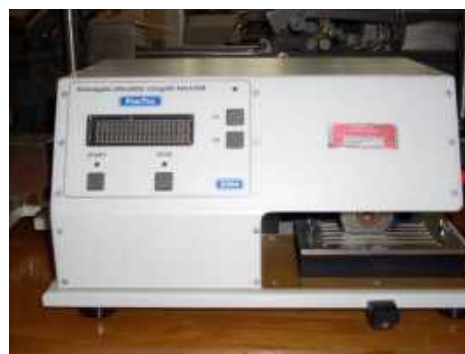
2. ábra. A késvágás mérőműszere az INNOVATEX Zrt. laboratóriumában