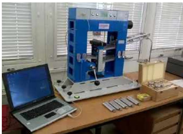
3. ábra. Éles tárgyak okozta vágás mérőműszere az MSZ EN ISO 13997:2000 szabvány szerint (TDM vizsgálat)

Nagy ellenállású kötött kelméknél a vizsgálat során a penge életlenné válhat, ezért megállapítottuk az éles szélek (kések, fémleapok egyes részei, fémforgács, üveg, pengét tartalmazó szerszámok) okozta vágás elleni védelmet az MSZ EN ISO 13997:2000 szabvány előírása szerint is. Az INNOVATEXT Zrt. laboratóriumában a 3. ábrán látható mérőműszer beszerzése a projekt támogatásával vált lehetővé, a műszer magyar fejlesztés eredménye. Az elvégzett vizsgálatok alapján a minták vágásvédelmi teljesítményszintje: B.