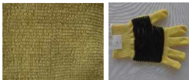
1. ábra. A rezgészsillapítás céljára hurkosított kelmék